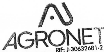
Zoraida Teran CPC No. 19575